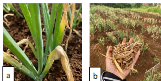
Gambar 3. a. Daun terinfeksi bercak ungu; b. Pembuangan daun rusak

Serangan penyakit bercak ungu dapat menyebabkan kehilangan hasil 3%-57% tergantung kondisi iklim pada saat penanaman (Hadisutrisno et al. , 1994).