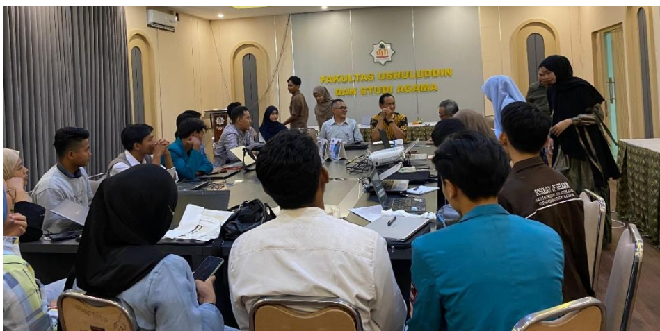
Gambar 4. Pelaksanaan Kelas Menulis secara Offline

Selain pelaksanaan latihan secara online , yakni grup WhatsApp, Zoom Meeting, dan sarana email, juga dilaksanakan pendampingan secara offline di bawah ini: