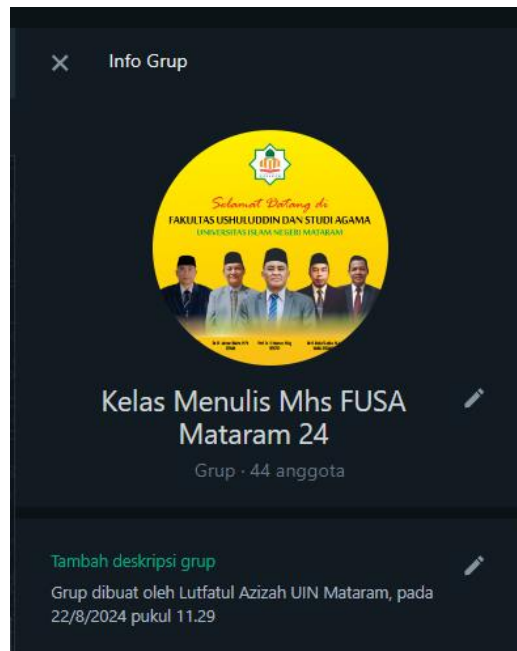
Gambar 1. Grup WhatsApp Kelas Menulis FUSA UIN Mataram