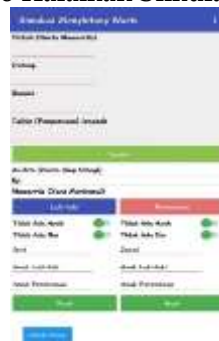
Gambar 8 Halaman Simulasi