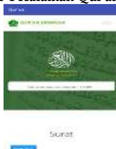
Gambar 4 Halaman Qur'an