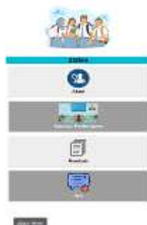
Gambar 10 Halaman Menu Akun Siswa