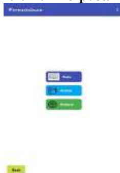
Gambar 7 Halaman Perpustakaan