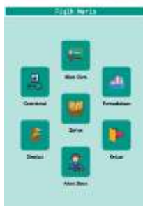
Gambar 2 Menu Utama