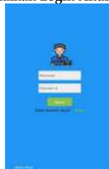
Gambar 9 Halaman Login Akun Siswa