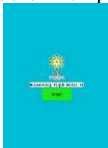
Gambar 1 Halaman Awal Aplikasi