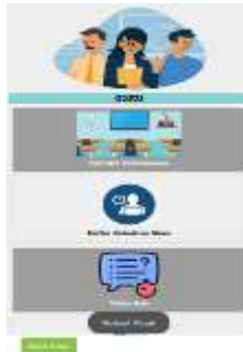
Gambar 6 Halaman Menu Akun Guru