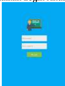
Gambar 5 Halaman Login Akun Guru