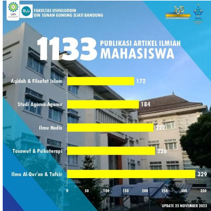
Tabel 2. Publikasi Ilmiah Mahasiswa Basis Program Studi

Fakultas Ushuluddin UIN Sunan Gunung Djati Bandung memiliki 5 (lima) Program Studi. Sebaran 1133 publikasi ilmiah mahasiswa masing-masing program studi Tahun 2019-2023 adalah: 1) Jurusan Ilmu Al-Qur'an dan Tafsir 329 artikel; 2) Jurusan Tasawuf dan Psikoterapi 226 artikel; 3) Jurusan Ilmu Hadis 222 artikel; 4) Jurusan Studi Agama-Agama 184 artikel; dan 5) Jurusan Aqidah dan Filsafat Islam 172 artikel.