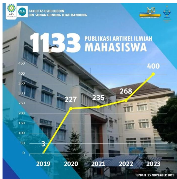
Tabel 1. Publikasi Ilmiah Mahasiswa

Capaian publikasi artikel ilmiah mahasiswa Fakultas Ushuluddin UIN Sunan Gunung Djati Bandung dihitung sejak Tahun 2019 sampai tanggal 25 November 2023. Tercatat sebanyak 1133 artikel mahasiswa berhasil terbit di jurnal ilmiah. Sebanyak 3 (tiga) artikel Tahun 2019, sebanyak 227 artikel Tahun 2020, sebanyak 235 artikel Tahun 2021, sebanyak 268 artikel Tahun 2022, dan sebanyak 400 artikel Tahun 2023.