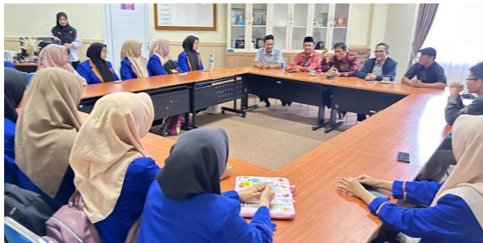
Gambar 7. Pelaksanaan Hari Kedua

Hari pertama merupakan lanjutan materi pra kegiatan. Mahasiswa yang telah tuntas sampai Tahap 11 diminta untuk mendampingi teman-temannya yang masih proses mengerjakan tahapan. Pada sesi ini ditunjukkan beberapa kesalahan teknis penulisan melalui in focus . Kesalahan teknis meliputi typo , margin , huruf besar dan huruf kecil, titik, koma, dan lain-lain. Peserta diarahkan untuk mengikuti apa adanya modul sebagai acuan latihan menulis.