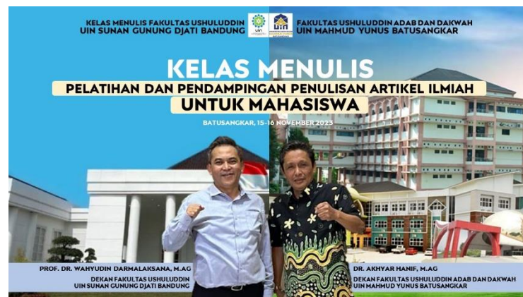
Gambar 1. Pendiri Kelas Menulis

Pelaksanaan kegiatan diawali Memorandum of Agreement (MoA) antara dua pihak. Pihak pertama Dekan Fakultas Ushuluddin UIN Sunan Gunung Djati Bandung dan pihak kedua Dekan FUAD UIN Mahmud Yunus Batusangkar. Kedua belah pihak sepakat membentuk dan mengembangkan Kelas Menulis. Pihak pertama bertanggungjawab sebagai fasilitator melalui Kelas Menulis Fakultas Ushuluddin UIN Sunan Gunung Djati Bandung. Pihak kedua menyiapkan fasilitas bagi pendirian Kelas Menulis FUAD UIN Mahmud Yunus Batusangkar. Tujuan pendirian Kelas Menulis adalah penguatan skills (keterampilan) penulisan artikel ilmiah bagi kalangan mahasiswa sekaligus percepatan publikasi ilmiah.