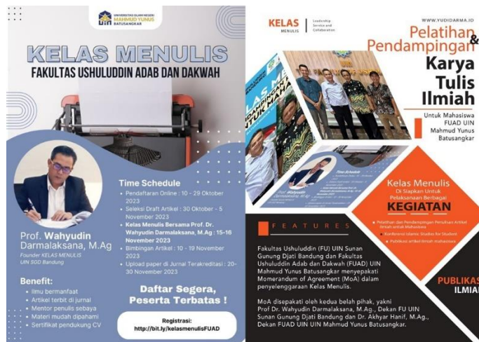
Gambar 2. Poster Kelas Menulis

ditetapkan sebagai target pencapaian Kelas Menulis melalui kegiatan pelatihan dan pendampingan kepenulisan artikel ilmiah.