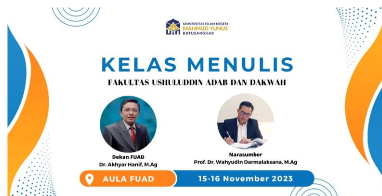
Gambar 5. Spanduk Kegiatan Offline