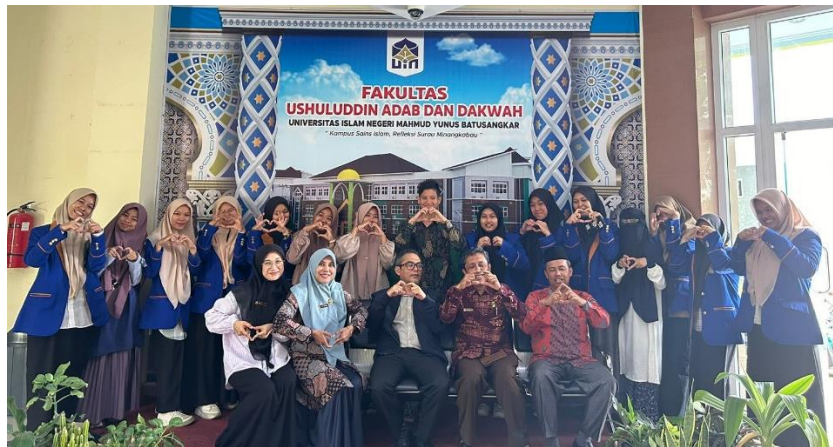
Gambar 8. Deklarasi Duta Kelas Menulis

Agenda hari kedua, Kamis, 16 November 2023, meliputi lanjutan materi hari pertama, ketentuan pasca kegiatan, dan penutupan. Peserta pada hari kedua bertambah menjadi 15 orang (Gambar 7). Agenda pasca kegiatan yaitu Re-See , cek plagiasi, paraphrase dan editing , pelaksanaan konferensi, pengiriman naskah artikel ke jurnal ilmiah, dan terakhir publikasi ilmiah. Re-See adalah peninjauan kembali naskah artikel area mana yang harus dipotong, ditambah, dan ditata ulang. Re-See melibatkan dosen sebagai ahli dalam bidang keilmuan spesifik. Selanjutnya, konferensi sebagai ajang bagi presentasi artikel di hadapan khalayak. Terakhir, publikasi ilmiah merupakan hal yang niscaya sebagai target utama dari pelatihan dan pendampingan penulisan artikel ilmiah. Terakhir, agenda penutupan pelaksanaan pendampingan.