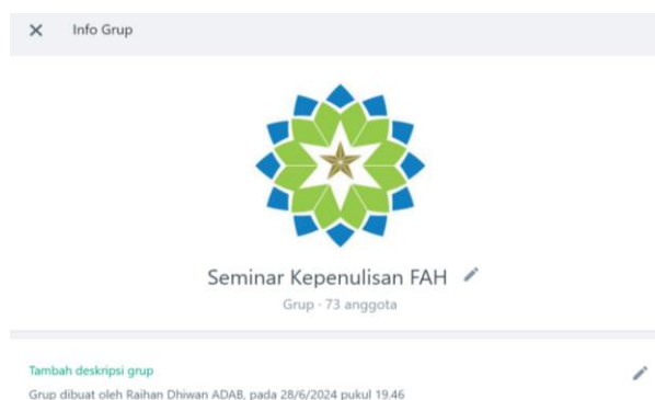
Gambar 2. Grup WhatsApp Kelas Menulis FAH

Selanjutnya, latihan menulis artikel ilmiah di lingkungan mahasiswa FAH dengan terlebih dahulu membuka WhatsApp Group, sebagaimana gambar di bawah ini: