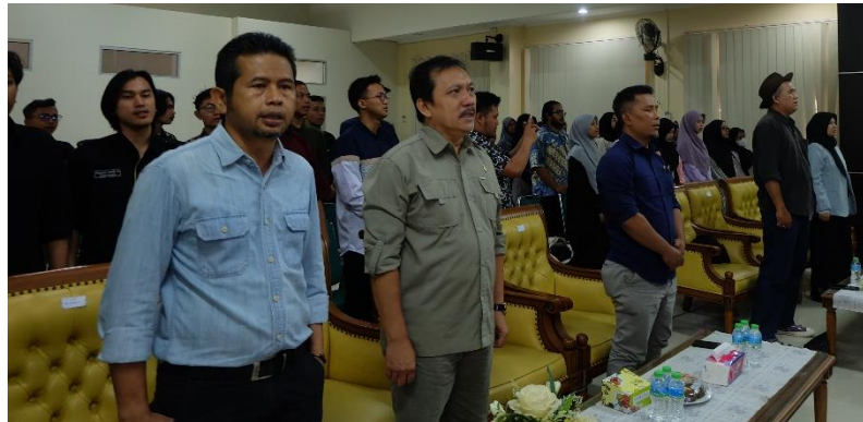
Gambar 1. Peluncuran Kelas Menulis FAH

Peluncuran Kelas Menulis FAH dilaksanakan oleh Dekan didampingi para Wakil Dekan, dan para dosen pembimbing. Peserta sebanyak 65 mahasiswa yang merupakan utusan dari 4 (empat) Program Studi (Prodi) atau Jurusan, yaitu Sejarah Peradaban Islam (SPI), Bahasa dan Sastra Arab (BSA), Sastra Inggris (BSI), dan Ilmu Perpustakaan dan Informasi Islam (IP). Hadir pula dalam agenda ini para tenaga kependidikan FAH.