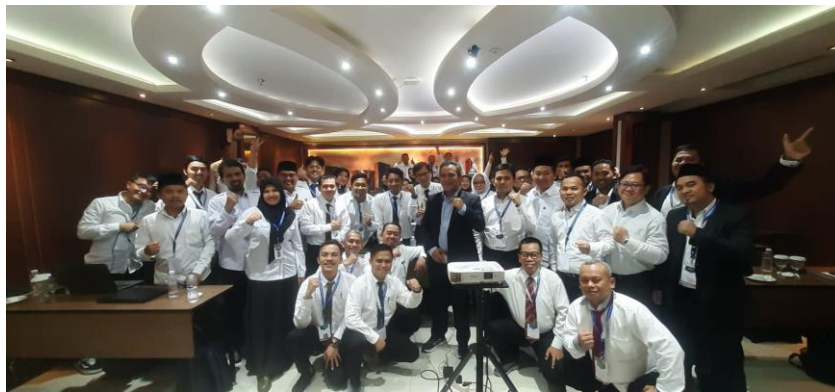
Gambar 1. Peserta PKDP LPM UIN Sunan Gunung Djati Bandung

Sosialisasi modul menulis artikel ilmiah ditujukan bagi peserta PKDP. Peserta sebanyak 45 Orang pada satu rombongan belajar. Materi PKDP di antaranya: 1) Penyusunan Rencana Pembelajaran Semester (RPS); 2) Moderasi beragama; 3) Perencanaan pembelajaran dan perancangan penugasan; 4) Dasar-dasar komunikasi pembelajaran; 5) Model, pendekatan, strategi, metode pembelajaran; 6) Penyusunan instrumen penilaian dan evaluasi pembelajaran; 7) Penulisan artikel ilmiah; 8) Karier dan jabatan dosen; dan 9) Kebijakan peningkatan kompetensi dosen pemula.