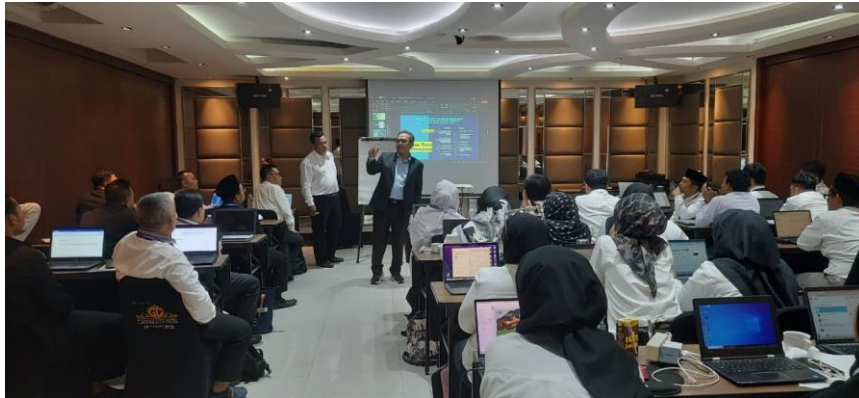
Gambar 2. Aktivitas Sosialisasi Modul pada Peserta PKDP

Keempat , prosedur menulis artikel ilmiah tahap demi tahap (Vera, Anditasari, et al., 2024). Hal yang ditegaskan di sini adalah pernyataan don't start at the beginning atau jangan mulai dari awal. Modul menempatkan latar belakang penelitian di Tahap 6, hal ini mengandung makna bahwa pikiran di bagian tersebut dapat berubah-ubah tanpa mendahulukan bagian-bagian utama dalam struktur artikel ilmiah. Prosedur bertahap dalam menulis artikel ilmiah diambil dari teknik computational thinking atau procedural thinking (Lasfeto et al., 2024). Terakhir, kelima , peringatan dan ketentuan batas-batas boleh dan larangan penggunaan Artificial Intelligent (AI) dalam karya ilmiah (Cui et al., 2024), seperti Open AI ChatGPT (Jauhainen & Garagorry Guerra, 2024).