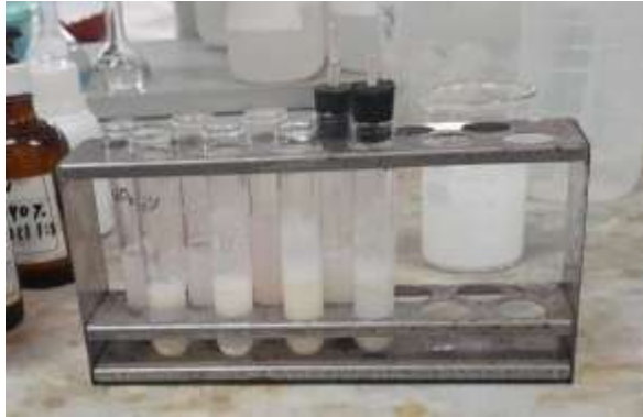
Gambar 1. hasil uji sianida, nitrit, arsen, dan logam berat pada tepung ISP.

logam berat. Senyawa-senyawa ini dipilih karena sifatnya yang sangat toksik, bahkan dalam kadar rendah, serta potensinya menyebabkan masalah kesehatan serius, seperti keracunan akut, gangguan sistem saraf, hingga kanker jika terakumulasi dalam tubuh.