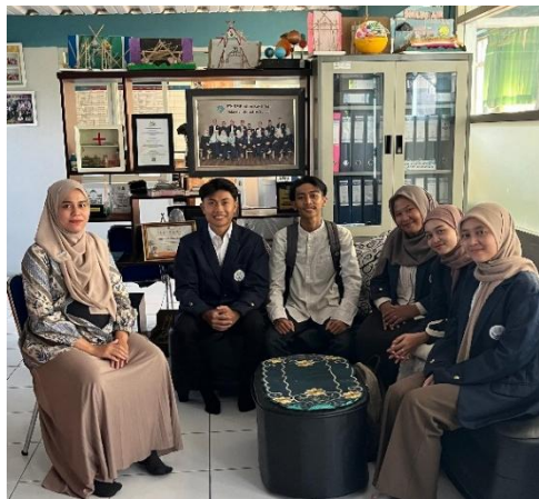
Gambar 1. Observasi Sekolah