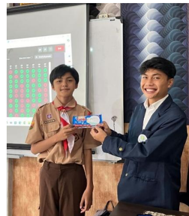
Gambar 6. Reward murid terbaik