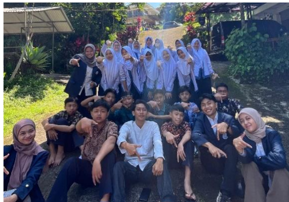
Gambar 4. Foto bersama murid setelah siklus 1