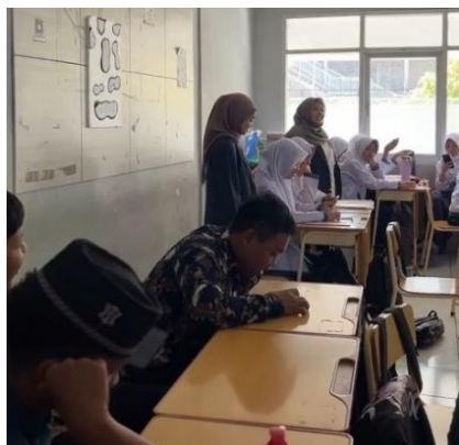
Gambar 3. Suasana kelas siklus 1