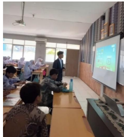
Gambar 2. Pelaksanaan Siklus 1