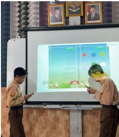
Gambar 5. Pelaksanaan siklus 2

Murid: Menurut saya, lebih efektif menggunakan e-book . Karena lebih praktis, menarik, dan ada banyak fitur yang membantu pemahaman saya, seperti gambar dan audio. Dulu, saya hanya membaca dari buku cetak, kadang saya jadi mengantuk dan kurang fokus.