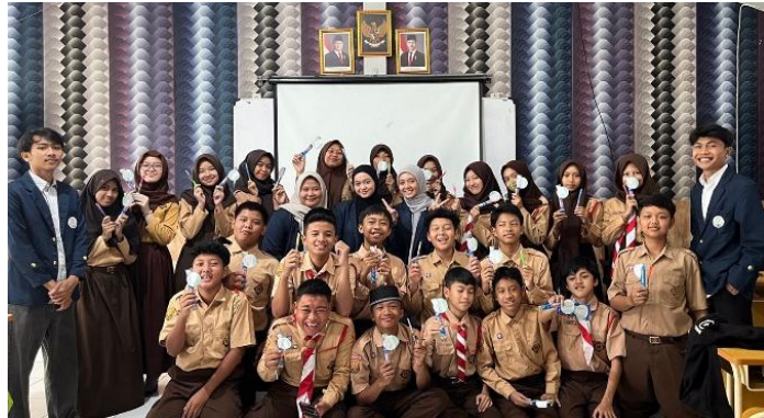
Gambar 7. Suasana kelas siklus 2