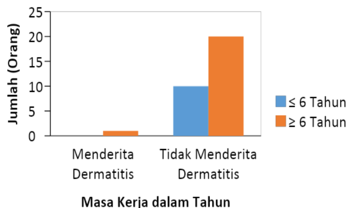
Gambar 2. Diagram Tabulasi Silang Berdasarkan Masa Kerja dengan Kejadian Dermatitis pada Mekanik Bengkel

menggunakan sabun dan air mengalir dalam membersihkan tangan dan kaki setelah bekerja. Mereka juga mandi sebanyak 2-3 kali dalam sehari dan mengganti pakaian bekerja setiap hari. Mekanik bengkel dengan kategori personal hygiene yang buruk diketahui bahwa mereka kurang menerapkan kebiasaan hidup bersih baik terhadap diri sendiri maupun lingkungannya.